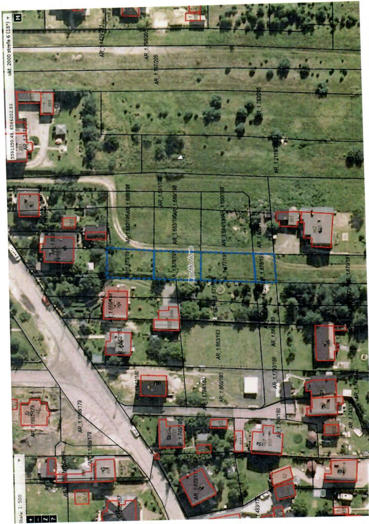
Działki nr 675/191, 676/191, 677/191, 678/191 obręb Nowe Czecho, rejon ulicy Powstańców, własność Gminy Świerklaniec.